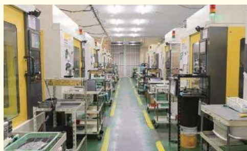
▲第二工場内の機械(一部)

今後も信頼される精度の高い製品をつくるため技術向上に努め、夢の工場を目指し、持てる知恵・技術を出し合い、努力を惜しまず仕事を通じて社会に貢献していきたいと思っております。