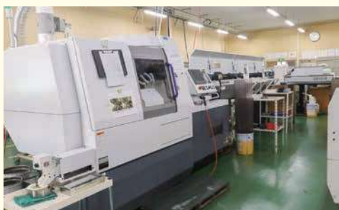
▲第一工場内の機械(一部)