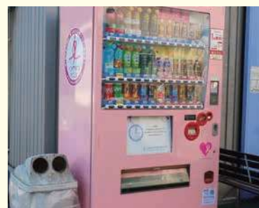
▲支援型自動販売機